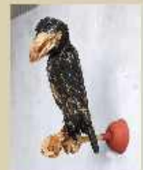
Thomas Putze Rabe 2016, Filz, Tische, Stempfer 36 x 32 x 30 cm