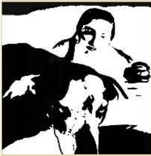
Hermann Schenkel Thomai, 2014 Leinwand auf Papier 20 x 25 cm