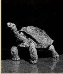
Gary Heery Gauguin's Tortoise 2010, Fotografie 150 x 100 cm