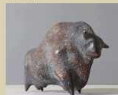
Gerold Jäggle Stier 2014, Bronze 148 x 60 cm