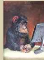
Rudi Hurzmeier Affe 2017, Acryl auf Papier 43 x 30 cm