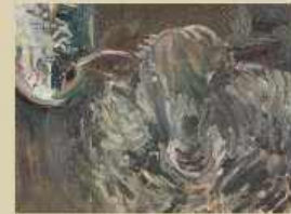
Thomas Nolden Großes Schaf 2015, Öl auf Leinwand 24 x 44 cm