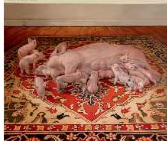
Hartmut Kiewert Yoppel 2017, Öl auf Leinwand 160 x 200 cm