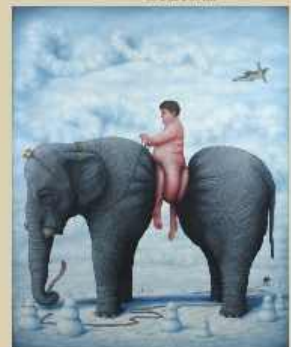
Bruno Pontiroli La douce de grande 2015, Öl auf Leinwand 200 x 160 cm