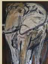
Volker Sonntag Elefant 1992, Acryl auf Leinwand 140 x 100 cm